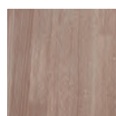
Cérusé blanc CB