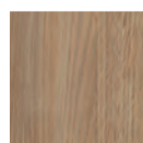
Naturel cérusé blanc NCB