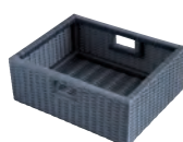
Rangements (Paniers, bancs, étagères)