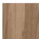
Huilé naturel HN